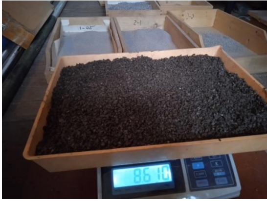
Рис. 2 Насичена на 1% руда на вагах