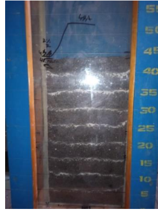
Рис. 3 Завантажений макет насиченою водою руди 6%

За такою методикою здійснювався випуск рудної масив. Дані по першій серії дослідів занесені до табл. 2.